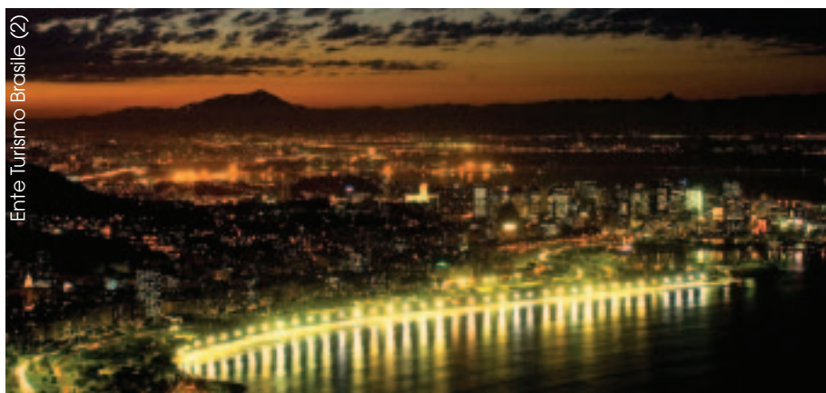
Ente Turismo Brasile (2)

Per festeggiare la “splendida cinquantenne” sono molte le iniziative nel corso del 2008. Nomi noti come Carlos Lyra, Roberto Menescal, Os Cariocas si alterneranno ad artisti emergenti in un calendario che, fino a luglio, propone 12 spettacoli al Centro Cultural Light (Av. Marechal Floriano 168, Rio de Janeiro - www.lightrio.com.br ). Nella stessa sede l'esposizione “50 anos de bossa nova, na mira da Rolley Flex” di Antonio Nery, fotografie in bianco e nero, che ritraggono i protagonisti nei locali storici all'inizio degli anni '60: il Beco das Garrafas, il Bacará e il Little Club. Anche Rádio Eldorado , emittente di Rio, compie 50 anni, e ha in programmazione tanta buona musica, curiosità, e interviste a Nelson Motta, Amilton Godoy (pianista del Zimbo Trio), Johnny Alf e molti altri. Intanto l'etichetta Som Livre ha appena pubblicato una nuova compilation (a breve disponibile): “Um cantinho, um violão e bossa nova” per rivisitare, chitarra e voce, i classici del genere, con nomi quali: Leila Pinheiro, Nana Caymmi, Wanda Sá e Durval Ferreira. Per gli appassionati cinefili, da rivedere “ Bossa Nova ”, commedia romantica di Bruno Barreto, presentata al festival di Berlino nel 2000. Per conoscere tutti gli eventi, molti in via di definizione, info al sito www.brazilfour.com .