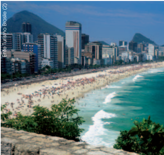
Ente Turismo Brasile (2)